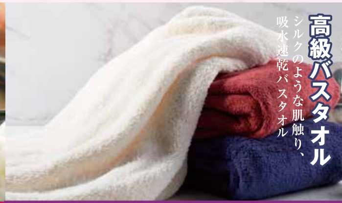
友の会入会プレゼント