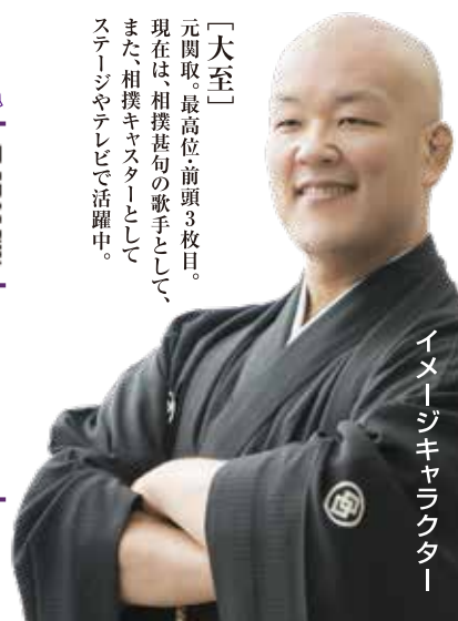
イメージキャラクター

「大至」 元関取、最高位前頭3枚目。 現在は、相撲甚句の歌手として、 また、相撲キャスターとして ステージやテレビで活躍中。