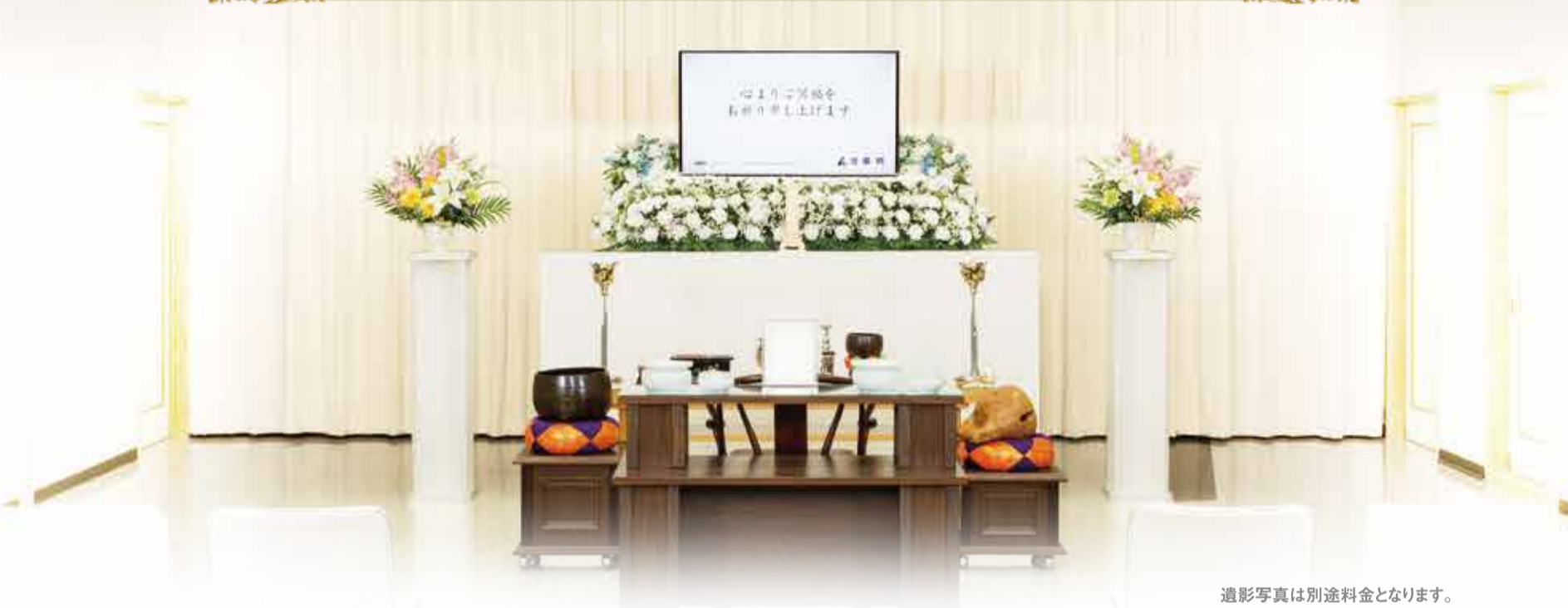
遺影写真は別途料金となります。