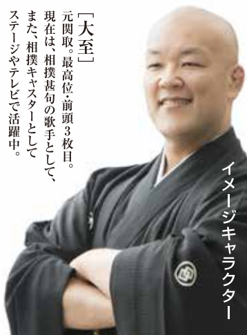
イメージキャラクター

「大至」 元関取。最高位前頭3枚目。 現在は、相撲甚句の歌手として、 また相撲キヤスターとして ステージやテレビで活躍中。