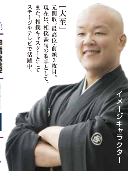
イメージキャラクター

「大至」 元関取、最高位前頭3枚目。 現在は、相撲甚句の歌手として、 また、相撲キャスターとして ステージやテレビで活躍中。