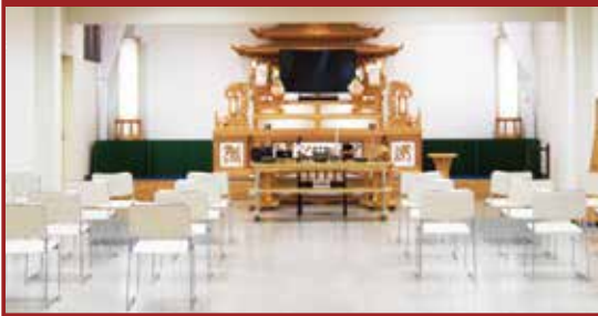
本町法要殿 2階式場 ～10名