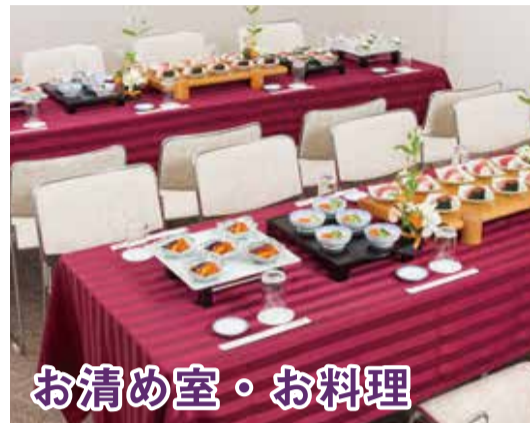
お清め室・お料理