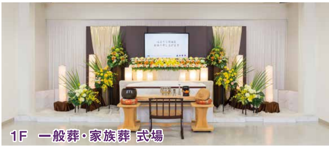
1F 一般葬・家族葬 式場