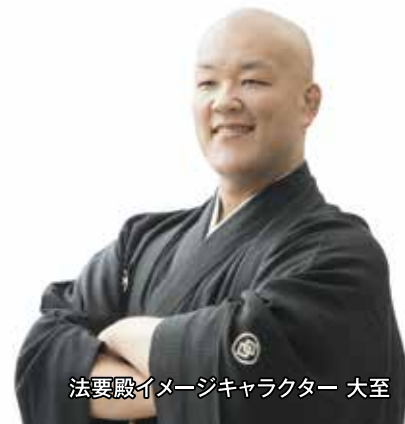
法要殿イメージキャラクター 大至