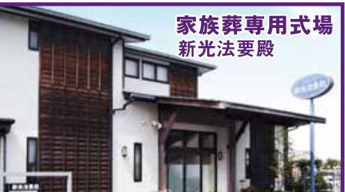
家族葬専用式場 新光法要殿