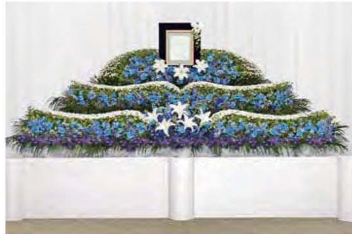
オリジナル花祭壇