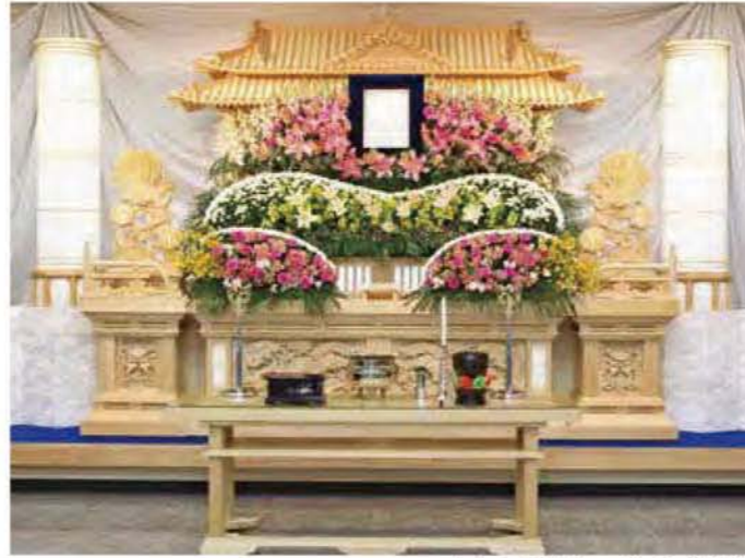
白木四段祭壇 円筒 生花飾付