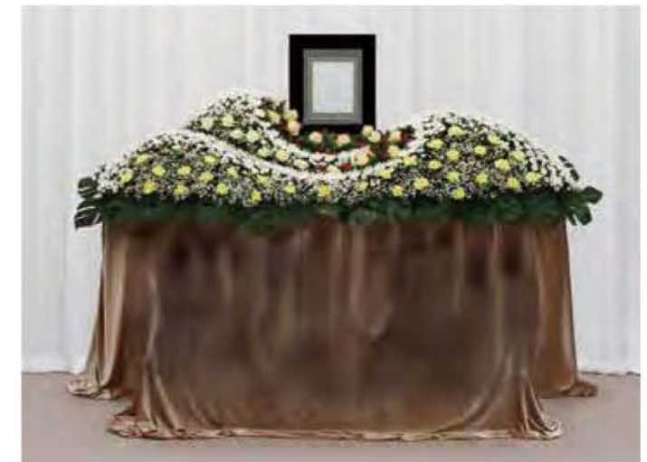
オリジナル花祭壇