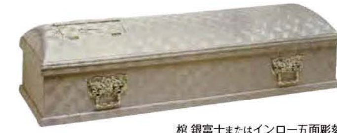
棺 銀富士またはインロー五面彫刻