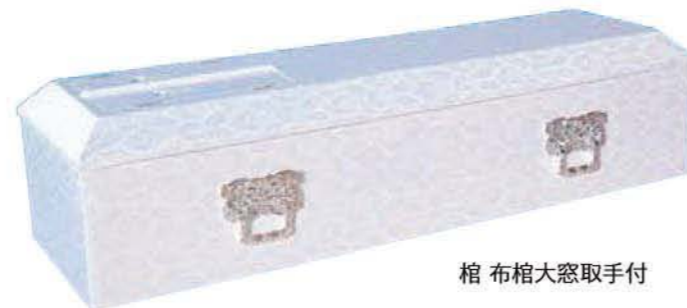
棺 布棺大窓取手付