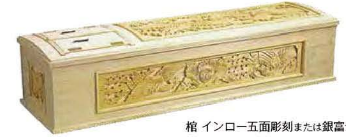
棺 インロー五面彫刻または銀富士