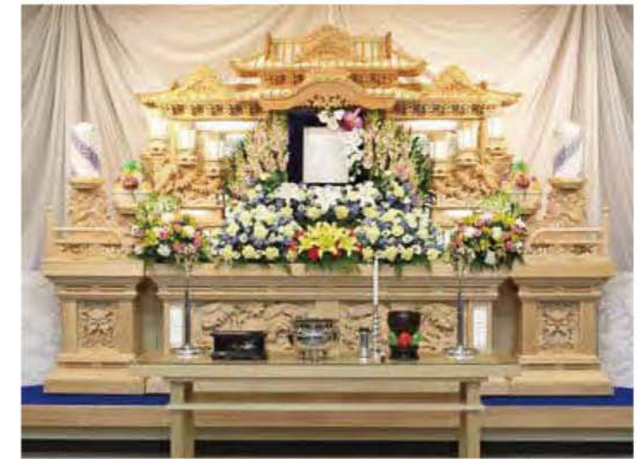
白木三段祭壇 生花飾付