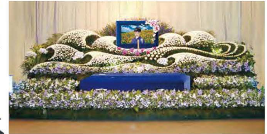
オリジナル花祭壇