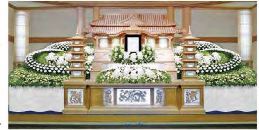
輿付生花スロープ祭壇 円筒 生花飾付