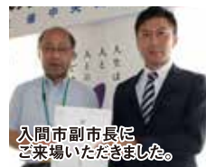
入間市副市長にご来場いただきました。

法要殿友の会会員様 800名以上のご参加頂いた“2024年友の会 チャリティゴルフ大会”にて皆さまよりお寄せいただいたチャリティ金を、入間市をはじめ埼玉西部地域6市1町へ寄付させていただきました。皆様のご協力、誠にありがとうございました。